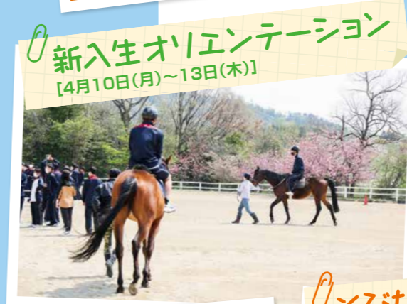
新入生オリエンテーション [4月10日(月)～13日(木)]