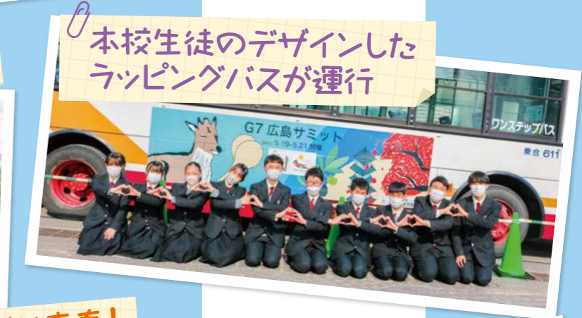
本校生徒のデザインした ラッピングバスが運行