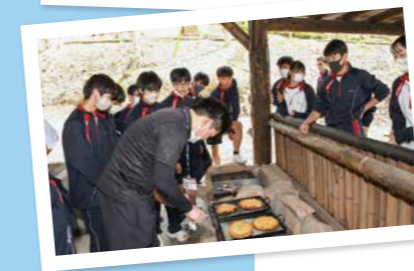
とびだせ青春! [5月2日(火)]